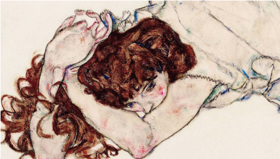
Detalle de portada de 'Referencial', de Ignacio Ferrando (Tusquets)

La juventud es ya el principal aval de cualquier persona que se proponga al escrutinio público